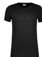
405 hp schwarz