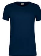
434 hp tinte