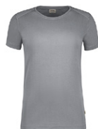
443 hp titan