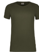
465 hp olive