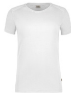
401 hp weiß

Ursprungsland Türkei Zolltarifnummer 6109 9020 Datenblatt Stand: 02/2023