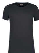
464 hp karbongrau