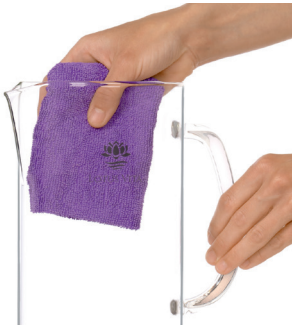
Glasfilterkanne mit Bambusdeckel

1. Entfernen Sie alle Verpackungen des Systems und der Filter und prüfen Sie, ob der Dichtungsring korrekt an der Filterkartusche sitzt.