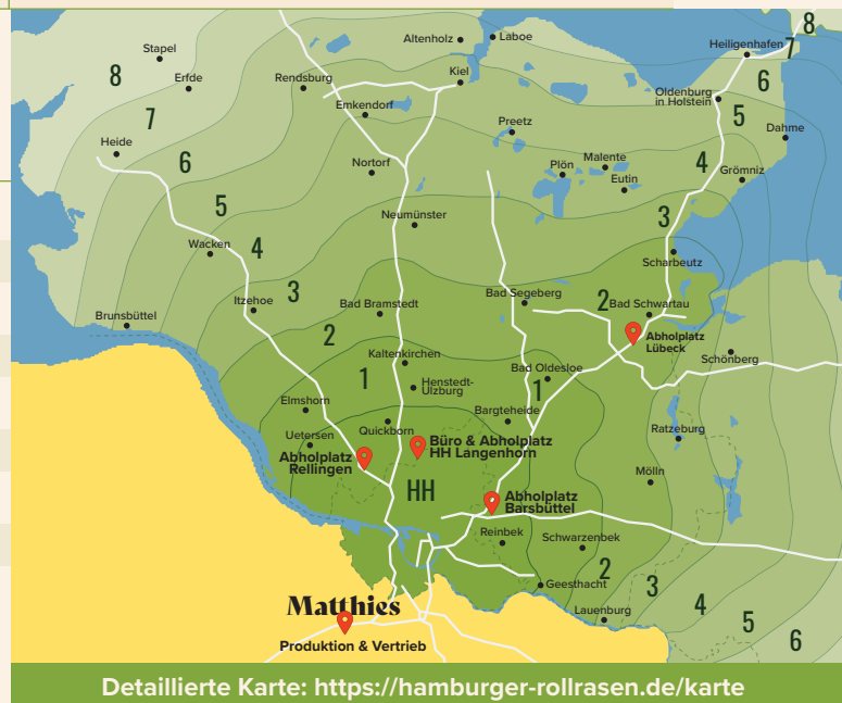
Detaillierte Karte: https://hamburger-rollrasen.de/karte