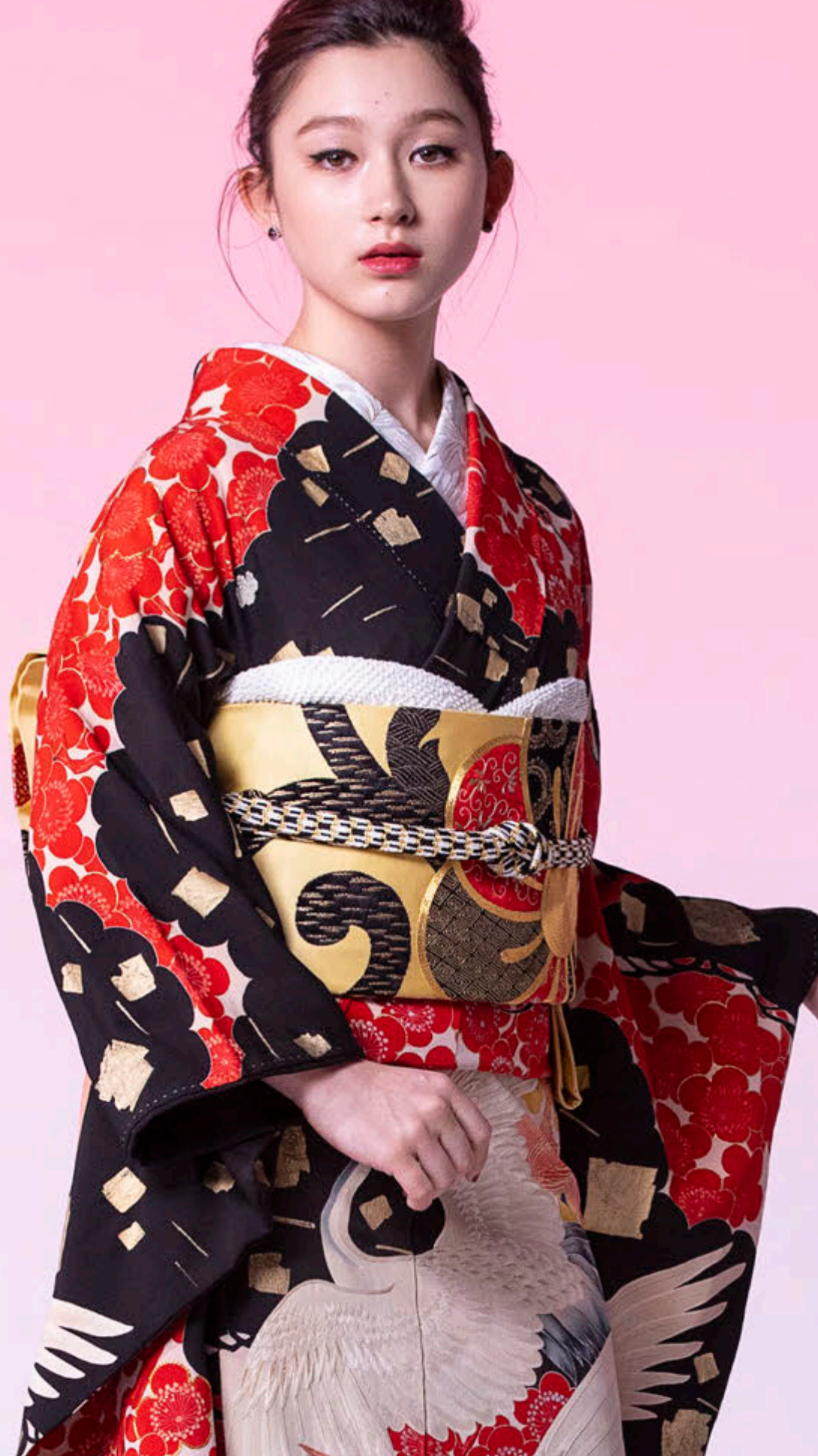
2. アンティーク振袖「暁光鶴孔雀図」 アンティーク袋帯「金菊刺繍紋」