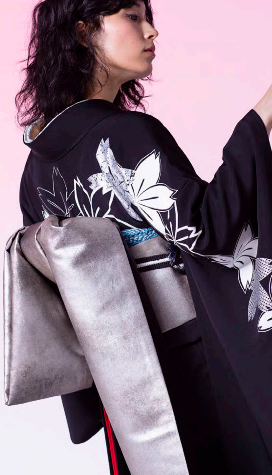
5. 振袖「白銀春秋文」 袋帯「桃山摺箔」