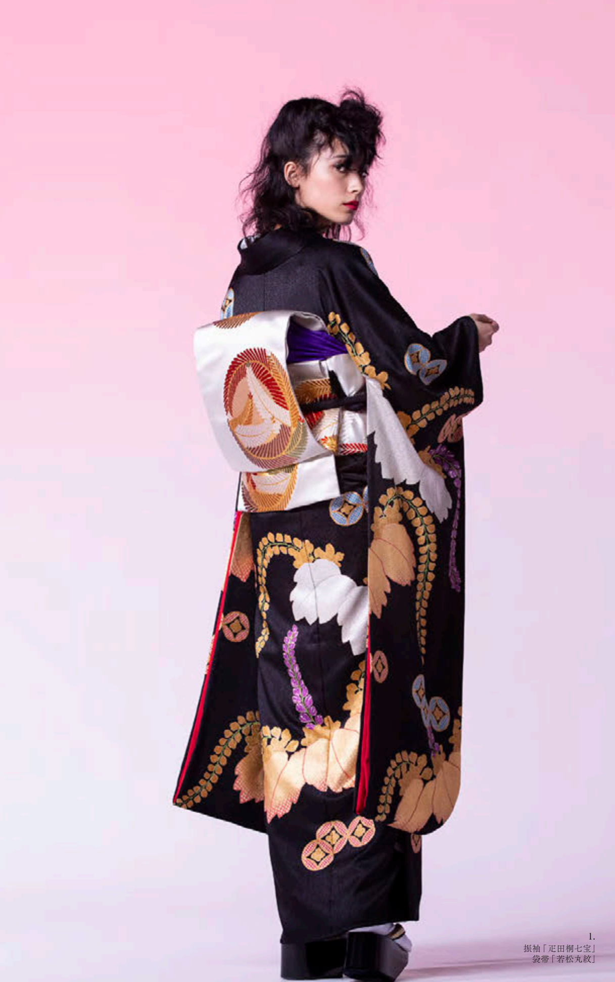
1. 振袖「疋田桐七宝」 袷帯「若松丸紋」