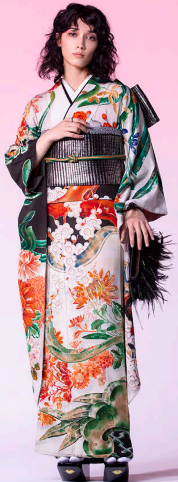
6. アンティーク振袖「花嵐装図」 袋帯「銀箔革漆横縞」