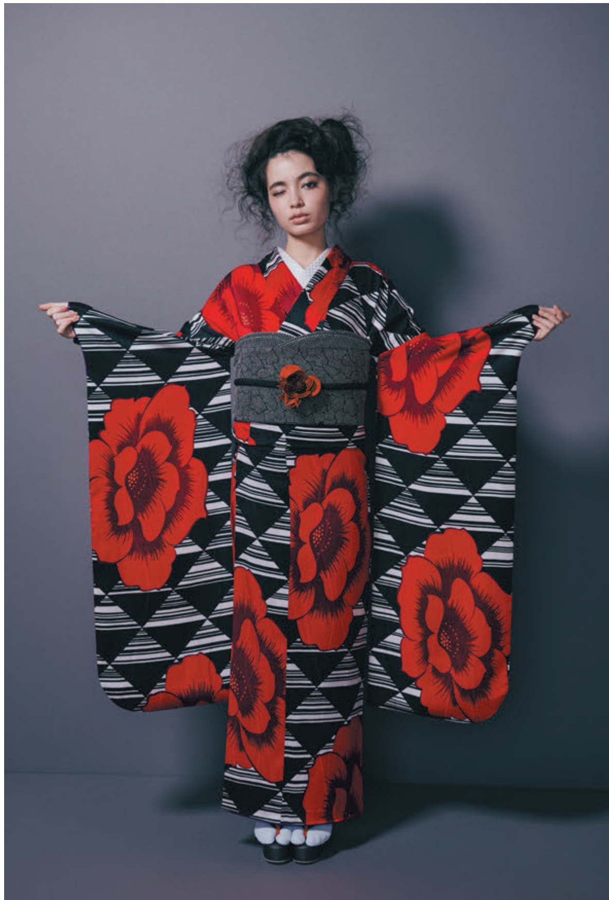
05 振袖「鱗牡丹」／袋帯「割れ貉菊」