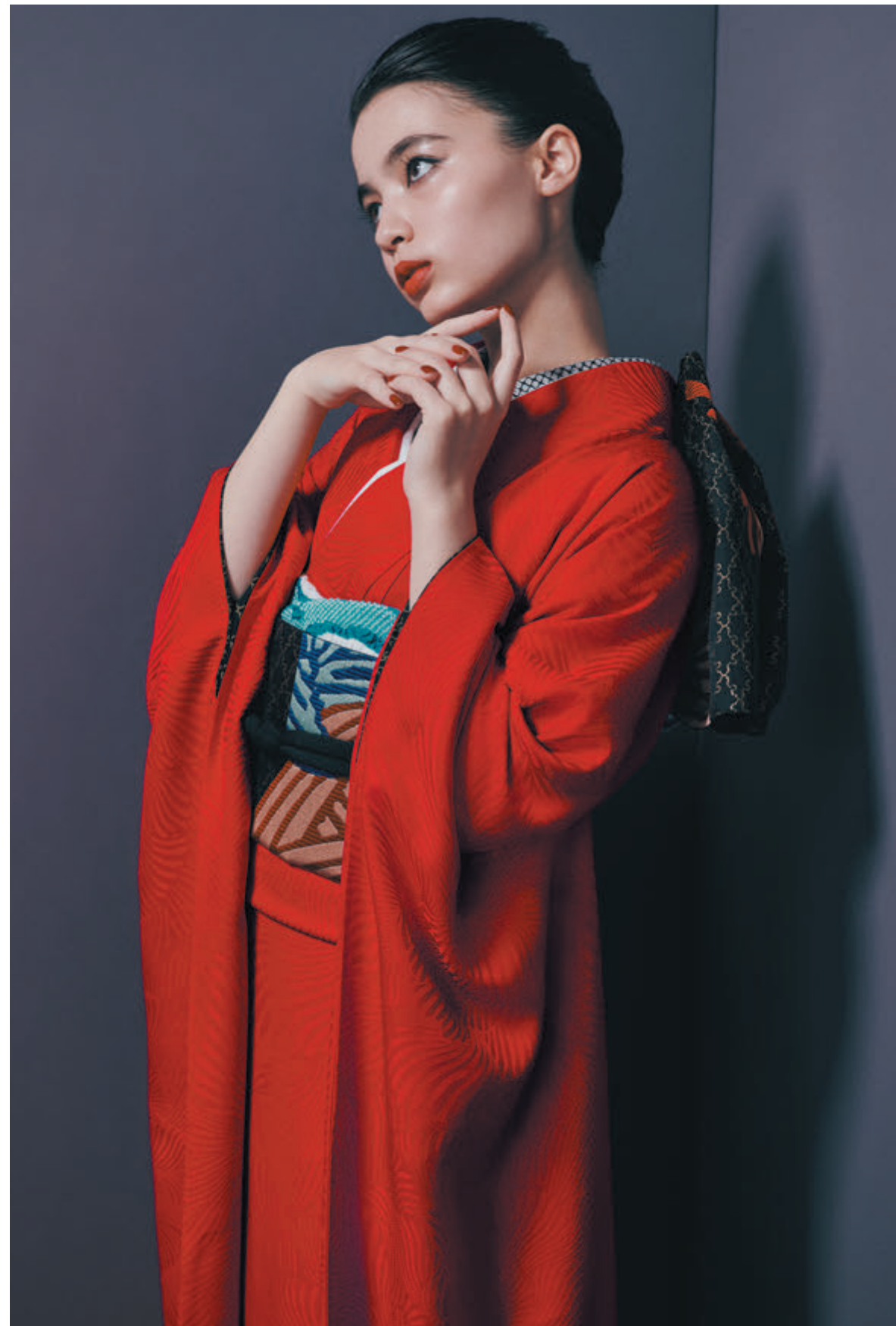
01 振袖「色無地線牡丹」／袋帯「雪持笹」