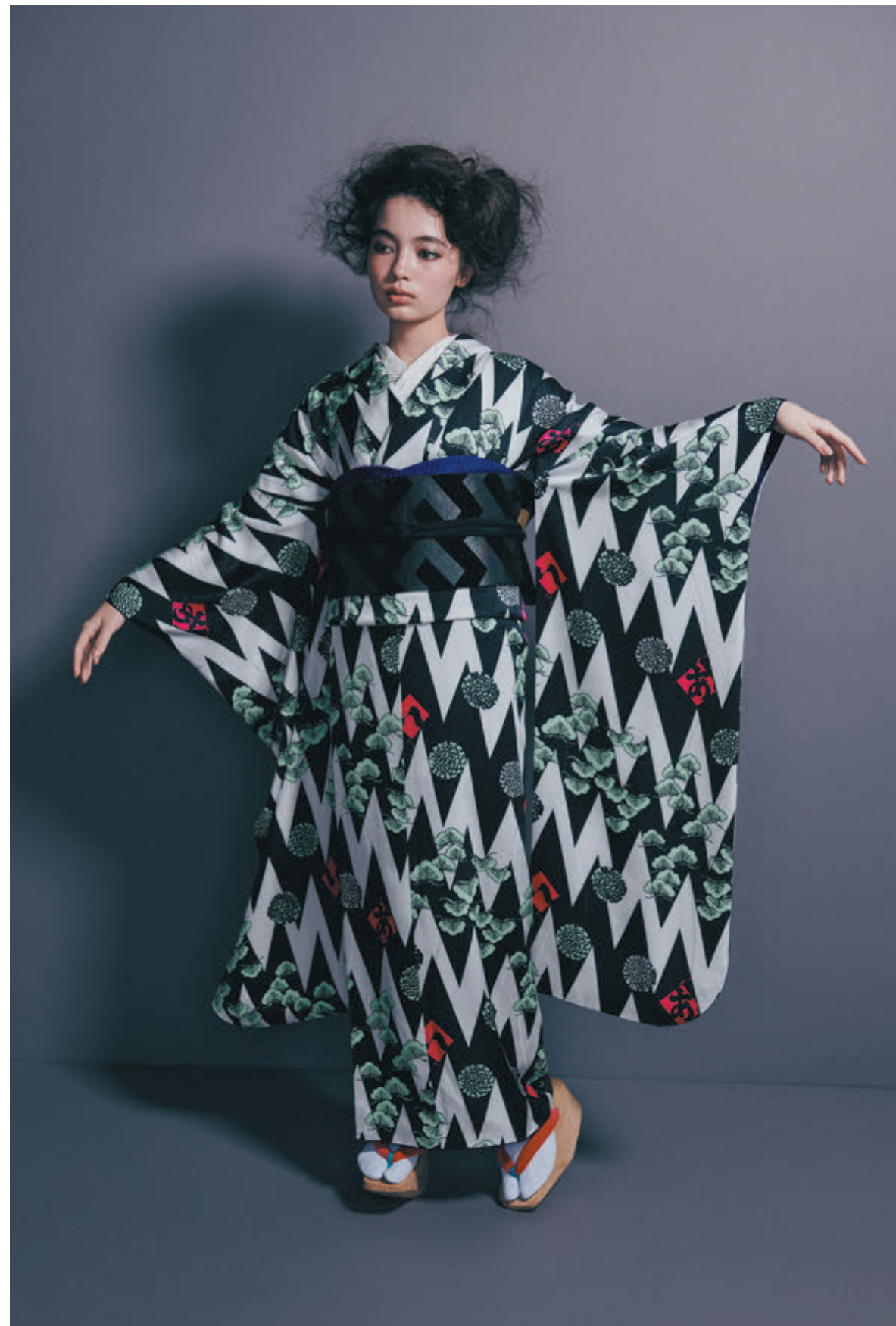
09 振袖「あい松」／袋帯「紗綾形」