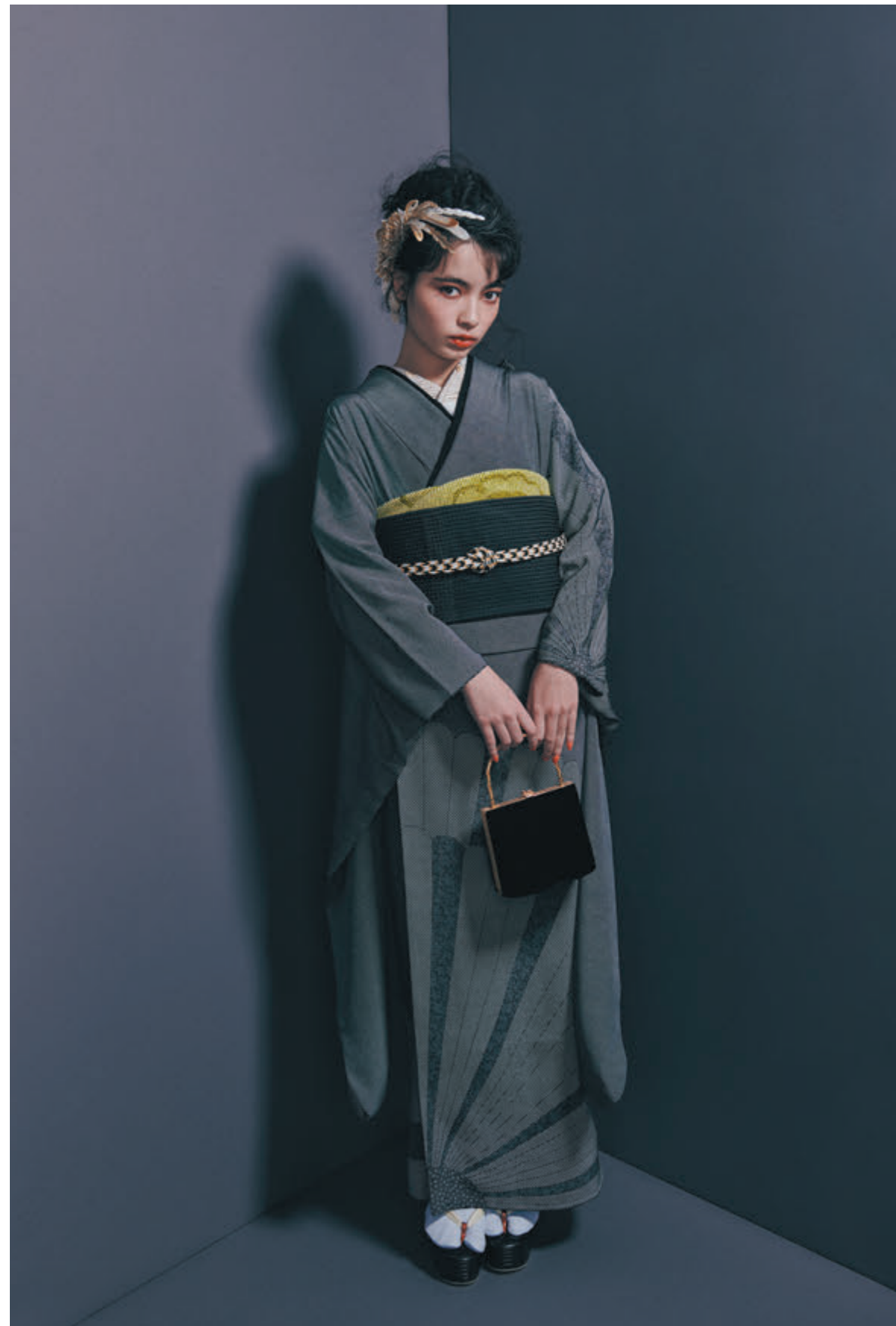
04 振袖「行儀地菊華紋」／袋帯「漆市松」