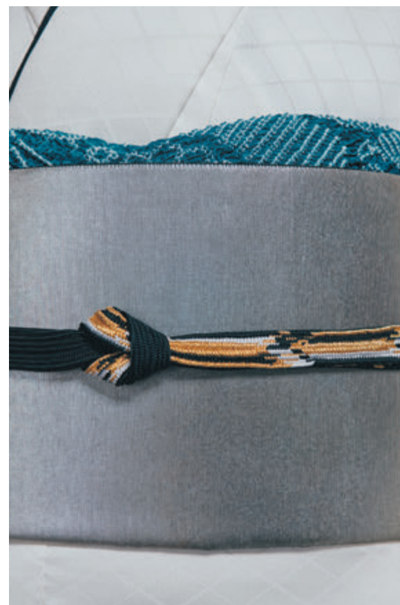
06 振袖「若笹」／袋帯「桃山摺笄」