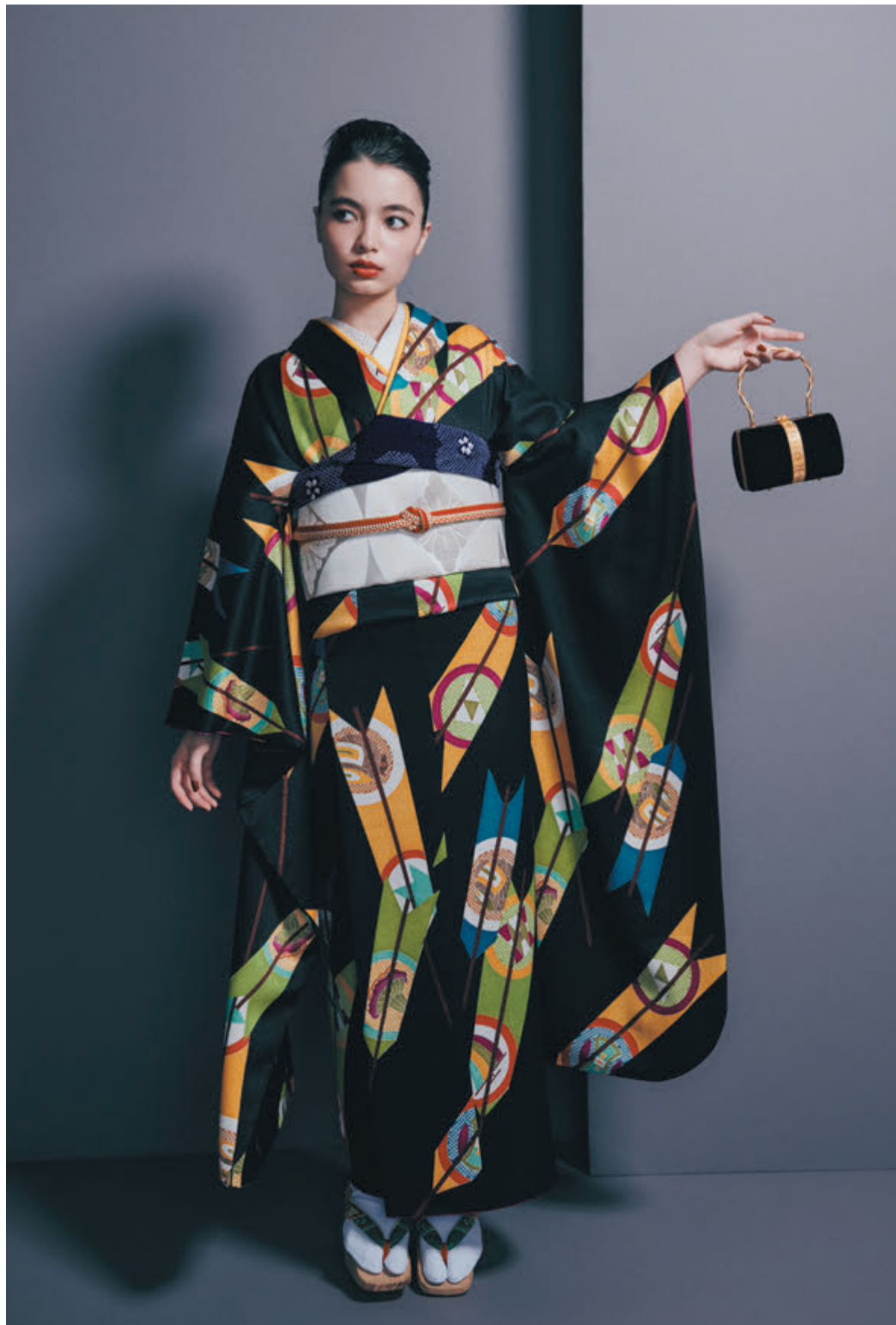
10 振袖「矢羽根」／袋帯「七宝 白」