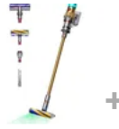
Dyson Aspirapolvere Senza Filo Dyson V12 Detect™ Slim (Oro)