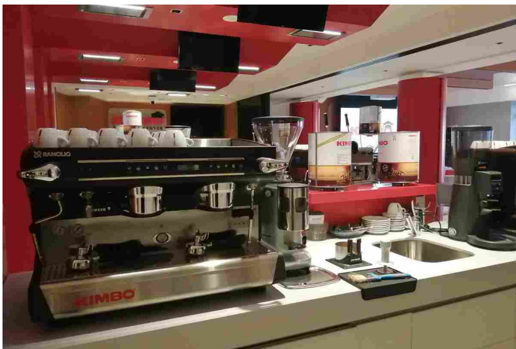
Trading Center Kimbo di Scampia

«Abbiamo sempre investito nella ricerca – ha detto il presidente della Kimbo Mario Rubino - e riteniamo che sia il momento della diffusione di una vera cultura del caffè, come da tempo ormai si fa per il vino. Era un mio vecchio sogno quello di aprire un luogo in cui poterne parlare, in cui unire cultura e ricerca di nuove miscele e di migliori tostature. L'eccellenza del prodotto non basta più e i baristi devono finalmente offrire un'adeguata esperienza di degustazione di quella che oggi è forse la bevanda più amata. Vogliamo lavorare proprio su quell'ultimo miglio dell'intero processo, impegnandoci da parte nostra a tutelarne la qualità nei passaggi della filiera».