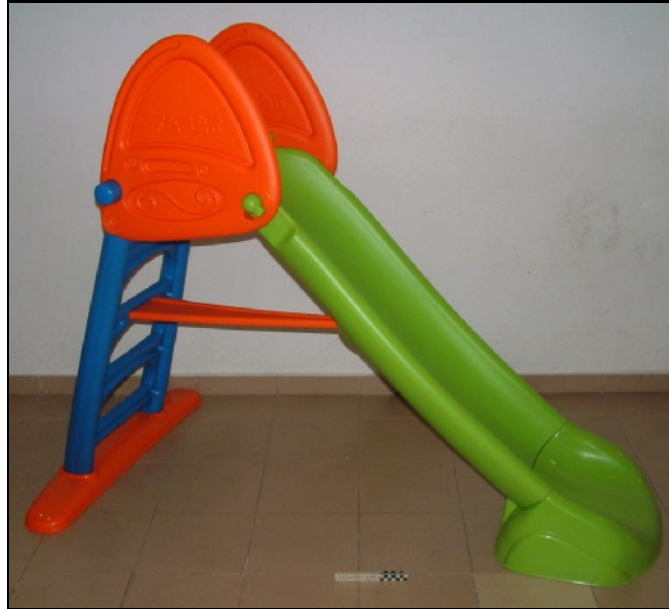
800006283 "FEBER SLIDE 10 WITH WATER" (en caja)