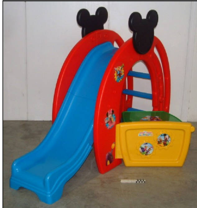
800005398 MMCH ACTIVITY HOUSE (en caja)