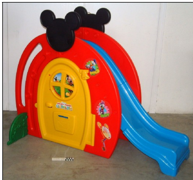
800005398 MMCH ACTIVITY HOUSE (en caja)