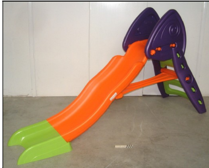
800003137 "070165 SUPER MEGA FOLDABLE SLIDE"