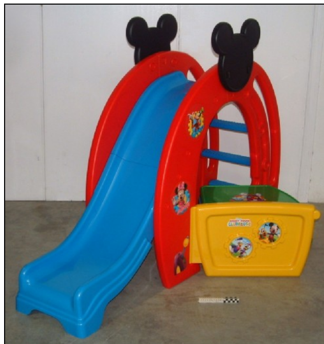
800005398 "MMCH ACTIVITY HOUSE"