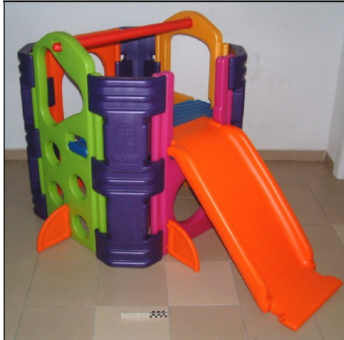
800002888 "Activity Park" (en caja)