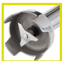
Navaja (TURLIC-650 y 850)