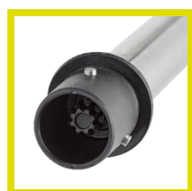
Doble perno de seguridad