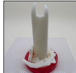
End of Burn Front - Sample 1