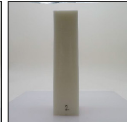
Before Burn Front - Sample 2