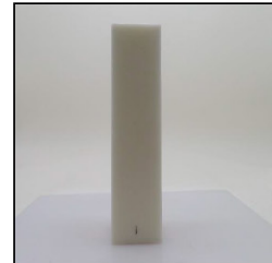
Before Burn Front - Sample 1