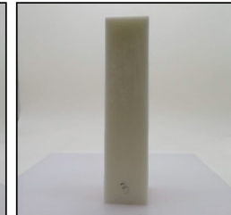
Before Burn Front - Sample 3