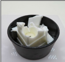
End of Burn Top - Sample 2