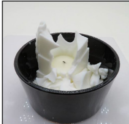
End of Burn Top - Sample 1