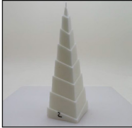
End of Burn Front - Sample 2