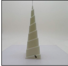
End of Burn Front - Sample 3