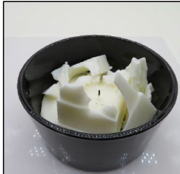
End of Burn Top - Sample 3