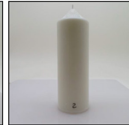
Before Burn Front - Sample 2