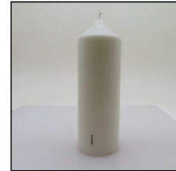
Before Burn Front - Sample 1