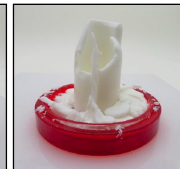
End of Burn Front - Sample 3