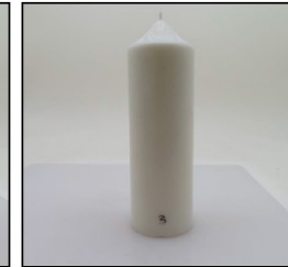
Before Burn Front - Sample 3