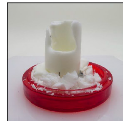
End of Burn Front - Sample 1