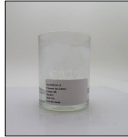
End of Burn Front - Sample 3