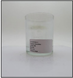
End of Burn Front - Sample 1