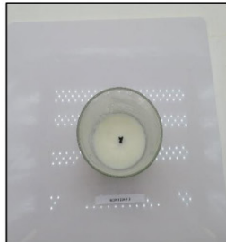
End of Burn Top - Sample 2