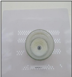
End of Burn Top - Sample 1