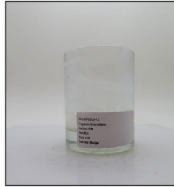
End of Burn Front - Sample 2