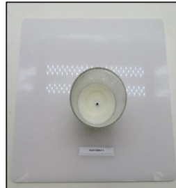
End of Burn Top - Sample 3