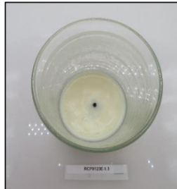
End of Burn Top - Sample 3