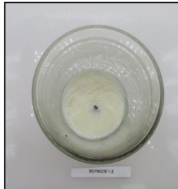
End of Burn Top - Sample 2