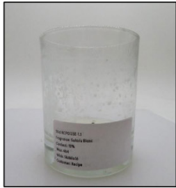
End of Burn Front - Sample 1