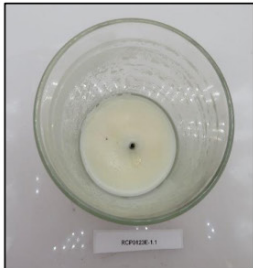
End of Burn Top - Sample 1