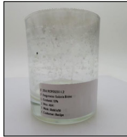
End of Burn Front - Sample 2