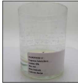
End of Burn Front - Sample 3