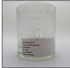
End of Burn Front - Sample 3