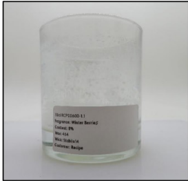
End of Burn Front - Sample 1