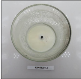
End of Burn Top - Sample 2