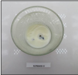
End of Burn Top - Sample 1