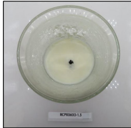
End of Burn Top - Sample 3