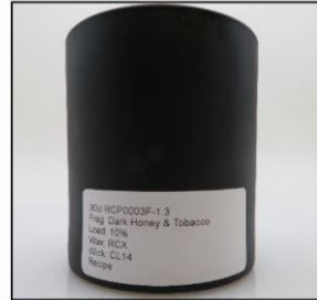
Before Burn Front - Sample 3