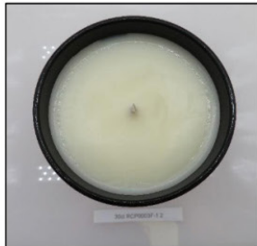
Before Burn Top - Sample 2