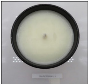
Before Burn Top - Sample 1