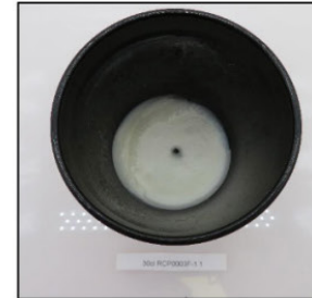
End of Burn Top - Sample 1