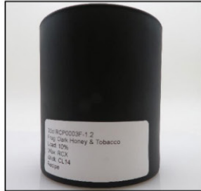
Before Burn Front - Sample 2