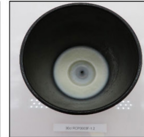
End of Burn Top - Sample 2