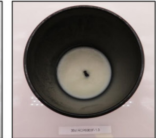
End of Burn Top - Sample 3