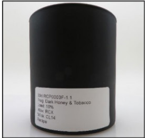
Before Burn Front - Sample 1