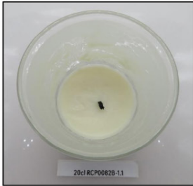
End of Burn Top - Sample 1