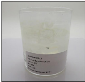
End of Burn Front - Sample 1