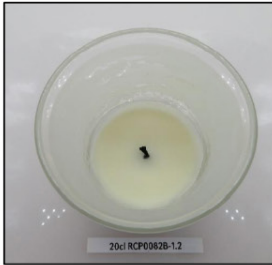
End of Burn Top - Sample 2