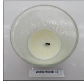
End of Burn Top - Sample 3