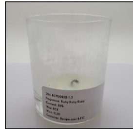
End of Burn Front - Sample 3