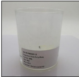
End of Burn Front - Sample 2