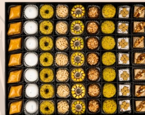
63 PÂTISSERIES AVEC COFFRET environ 116.000DT