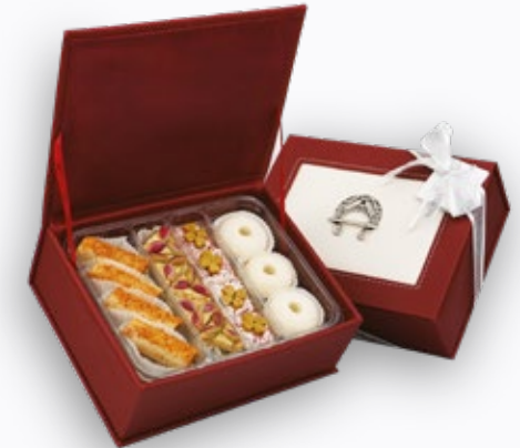
001304 LUXIA DAHLIA 30 PÂTISSERIES AVEC COFFRET 77.000DT