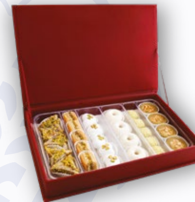
001303 LUXIA JASMIN 28 PÂTISSERIES AVEC COFFRET 77.000DT