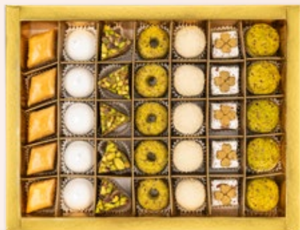
35 PÂTISSERIES AVEC COFFRET environ 78.000DT