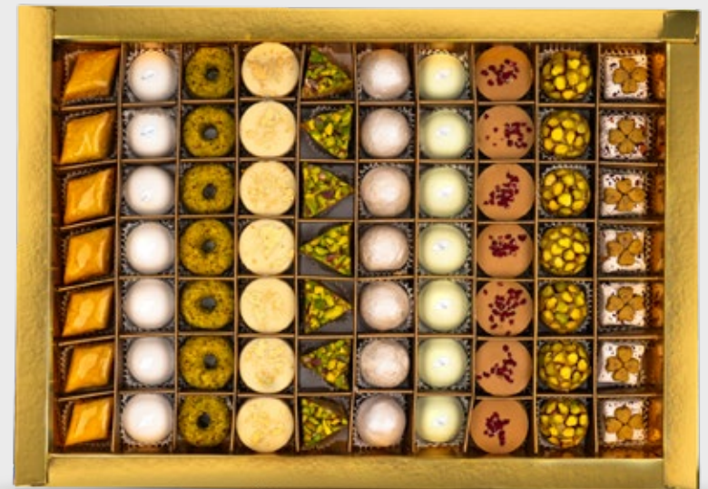
70 PÂTISSERIES AVEC COFFRET environ 146.000DT