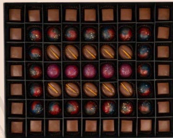
63 CHOCOLATS AVEC COFFRET environ 105.000DT