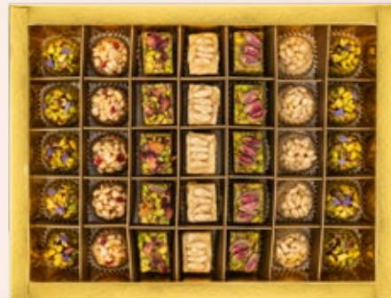
35 PÂTISSERIES AVEC COFFRET environ 116.000DT

(* ) Les prix indiqués dans ce catalogue sont à titre indicatif et peuvent changer selon la composition et l'évolution des prix.