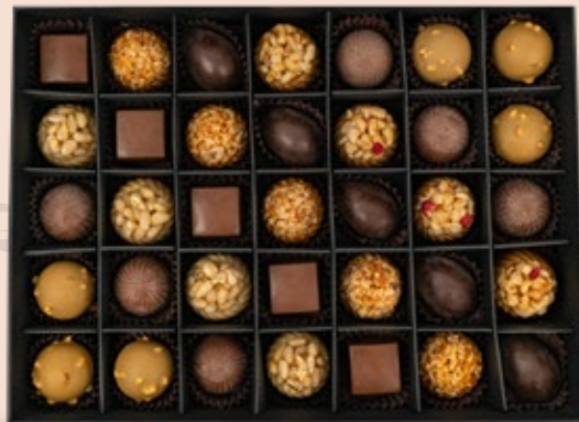
35 CHOCOLATS AVEC COFFRET environ 93.000DT