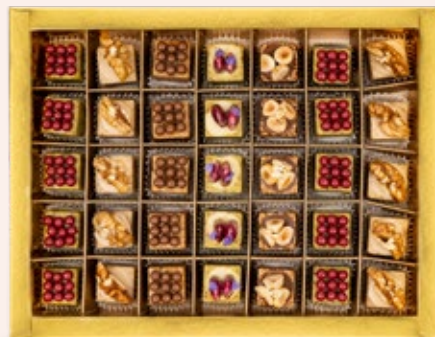
35 PÂTISSERIES AVEC COFFRET environ 85.000DT