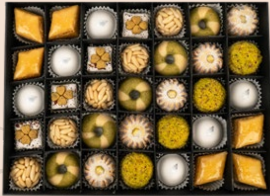
35 PÂTISSERIES AVEC COFFRET environ 65.000DT