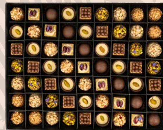
63 PÂTISSERIES AVEC COFFRET environ 126.000DT

(*) Les prix indiqués dans ce catalogue sont à titre indicatif et peuvent changer selon la composition et l'évolution des prix.