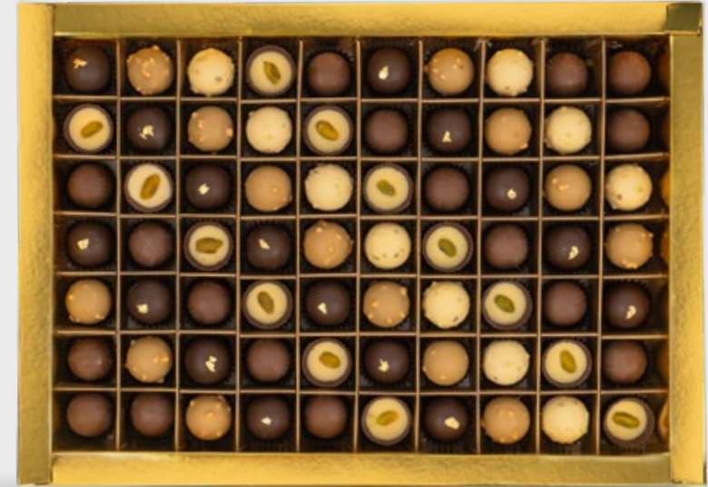
70 CHOCOLATS AVEC COFFRET environ 138.000DT