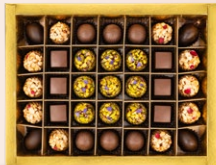
35 PÂTISSERIES AVEC COFFRET environ 83.000DT