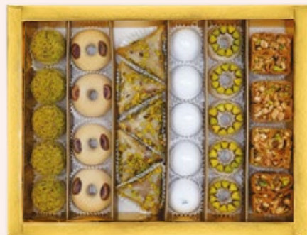
28 PÂTISSERIES AVEC COFFRET environ 48.000DT