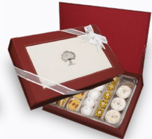
001305 LUXIA ÉPANOUIE 54 PÂTISSERIES AVEC COFFRET 113.000DT