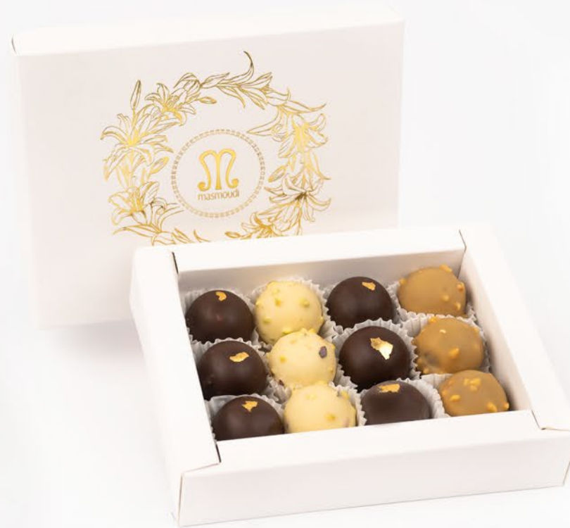
2. ECRIN GOURMAND 12 PÂTISSERIES AVEC COFFRET environ 28.500DT