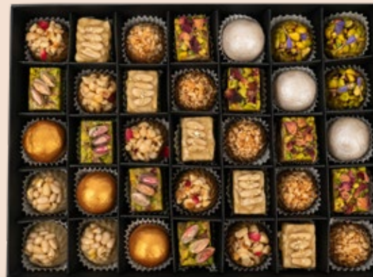
35 PÂTISSERIES AVEC COFFRET environ 120.000DT