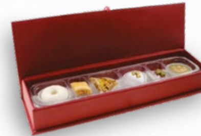
001302 ÉTUI LUXIA 6 PÂTISSERIES AVEC COFFRET 25.000DT