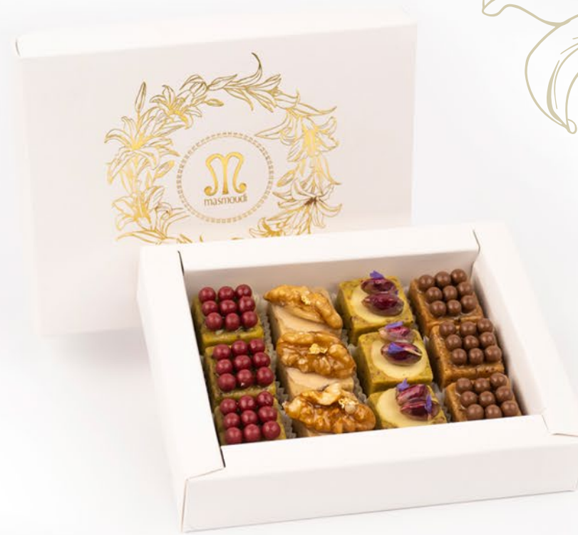
3. ECRIN GOURMAND 46 PÂTISSERIES AVEC COFFRET environ 32.000DT