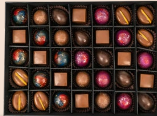
35 CHOCOLATS AVEC COFFRET environ 72.000DT