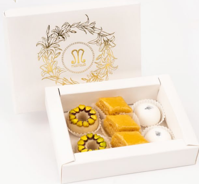
1. ECRIN GOURMAND 6 PÂTISSERIES AVEC COFFRET environ 14.000DT

(*) Les prix indiqués dans ce catalogue sont à titre indicatif et peuvent changer selon la composition et l'évolution des prix.