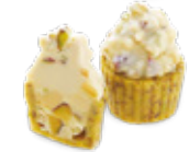
CODE 352 CUPCAKE PISTACHE كاب كايك فستق 65 pâtisseries /156dt