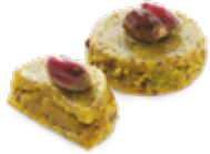
CODE 355 COURONNE PISTACHE كوران فستق 55 pâtisseries /207dt