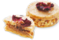
CODE 354 COURONNE NOISETTE كوران بوفريوة 60 pâtisseries /139dt