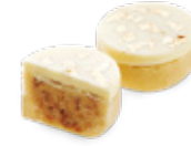
CODE 356 TARTINE AMANDE تارتين لوز 55 pâtisseries /135dt