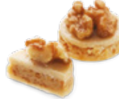
CODE 353 COURONNE AMANDE كوران لوز 55 pâtisseries /121dt