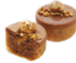
CODE 357 TARTINE NOISETTE تارتين بوفريوة 55 pâtisseries /158dt