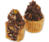
CODE 351 CUPCAKE NOISETTE كاب كايك بوفريوة 65 pâtisseries /133dt