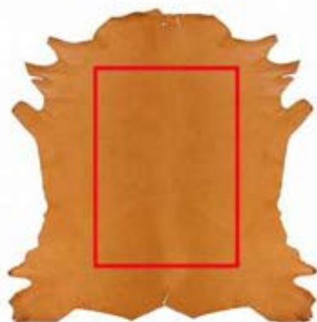
機械生産では中心以外は処分