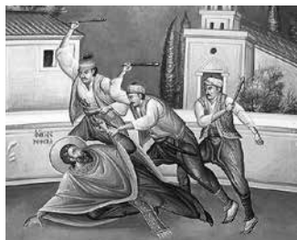
Mucenicia Sfântului Rafail, frescă.