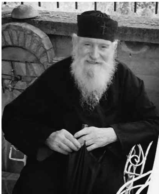
Părintele Ioannis la cinstite cărunteți.