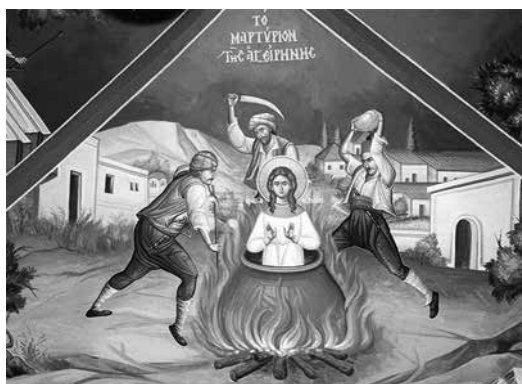
Mucenicia Sfintei Irina, frescă