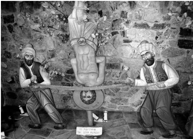
Scena fierăstruirii prin gură a Sfântului Mucenic Rafail de către agareni, aflată în curtea unei credincioase din Attica.