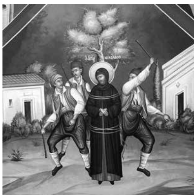
Mucenicia Sfântului diacon Nicolae, frescă