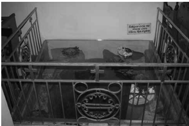
Vasul de lut în care a fost arsă de vie Sfânta Muceniță Irina, Mănăstirea Sfântului Rafail, Lesvos.