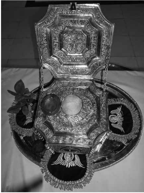
Capul Sfântului Mucenic Rafail din Mănăstirea sa, insula Lesvos.