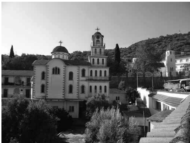
Mănăstirea Sfântului Mucenic Rafail din insula Lesvos.