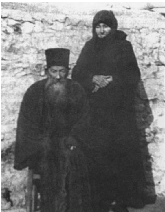
Sfântul Sava și Cuvioasa Filoteia, igumena Mănăstirii Tuturor Sfinților.