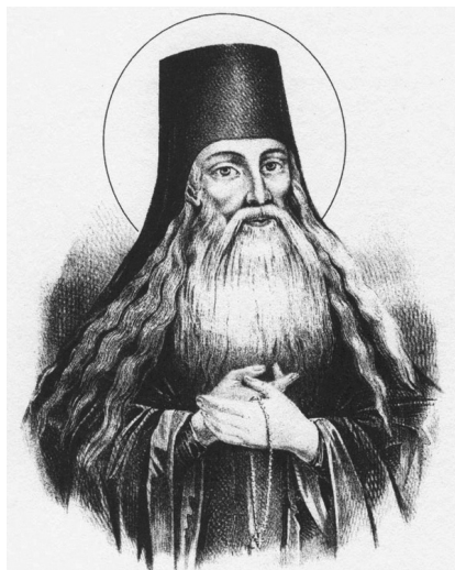
Cuviosul Paisie Velicikovski, a cărui predanie isihastă l-a înrâurit foarte mult pe Sfântul Gherman întreaga sa viață.