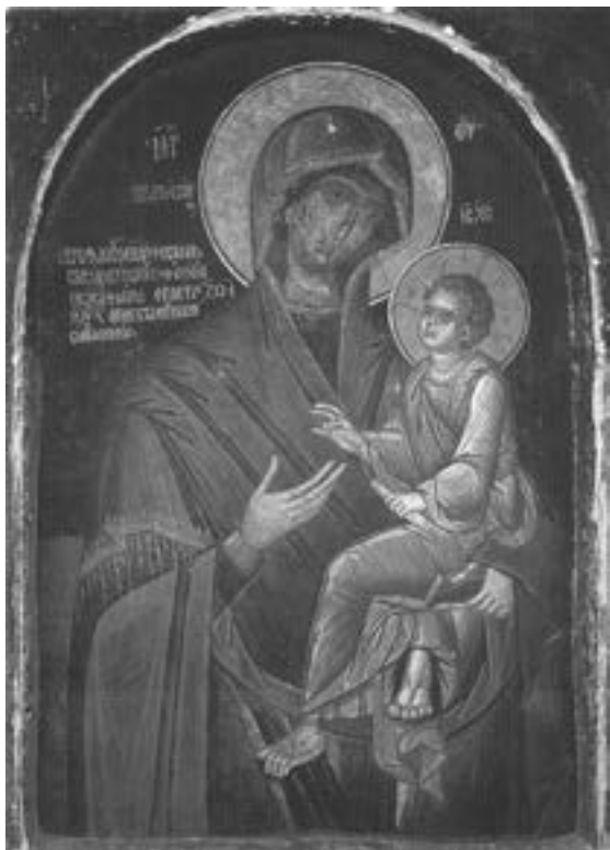
Icoana Maicii Domnului Grabnic-Ascultătoarea (gr. Panagia Gorgoypikoos ) de la Mănăstirea Dohiariu, Sfântul Munte Athos.