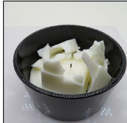
End of Burn Top - Sample 3