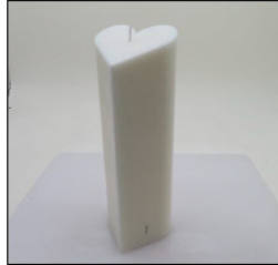
Before Burn - Sample 1