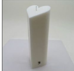
Before Burn - Sample 3