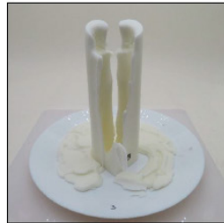
After Burn - Sample 3