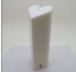
Before Burn - Sample 2