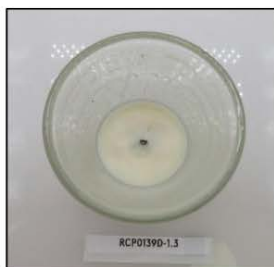
End of Burn Top - Sample 3