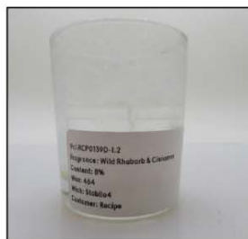
End of Burn Front - Sample 2