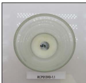
End of Burn Top - Sample 1