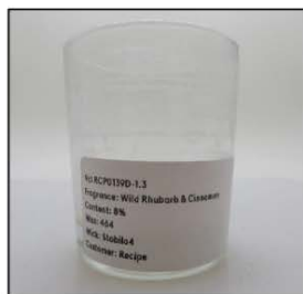
End of Burn Front - Sample 3