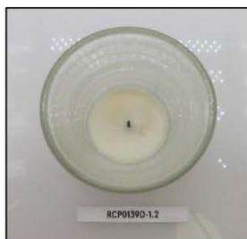
End of Burn Top - Sample 2