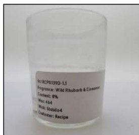
End of Burn Front - Sample 1