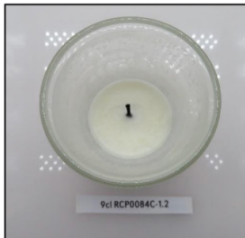
End of Burn Top - Sample 2