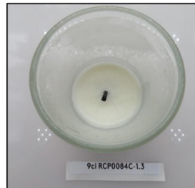
End of Burn Top - Sample 3