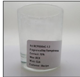
End of Burn Front - Sample 3