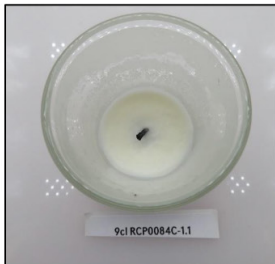
End of Burn Top - Sample 1