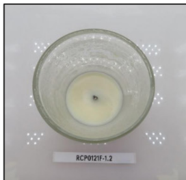
End of Burn Top - Sample 2