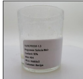
End of Burn Front - Sample 3