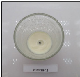
End of Burn Top - Sample 1