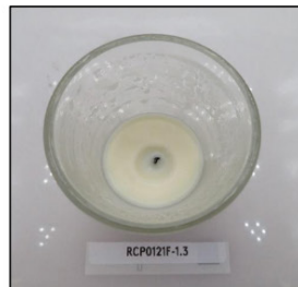
End of Burn Top - Sample 3