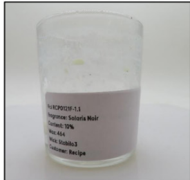
End of Burn Front - Sample 1