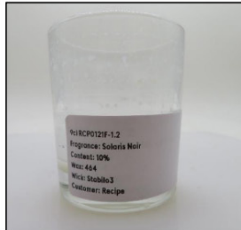
End of Burn Front - Sample 2