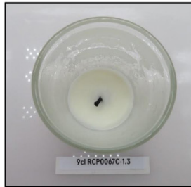
End of Burn Top - Sample 3