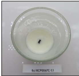
End of Burn Top - Sample 1