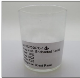
End of Burn Front - Sample 2