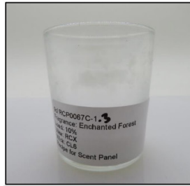
End of Burn Front - Sample 3