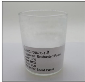
End of Burn Front - Sample 1