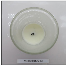
End of Burn Top - Sample 2