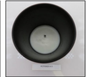
End of Burn Top - Sample 3