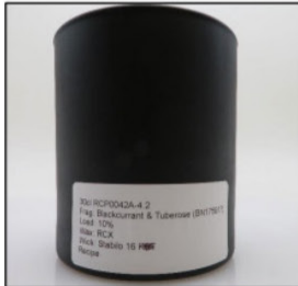
Before Burn Front - Sample 2