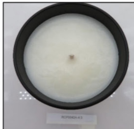
Before Burn Top - Sample 3