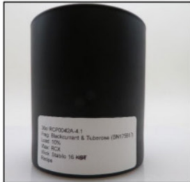
Before Burn Front - Sample 1