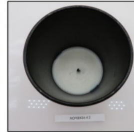
End of Burn Top - Sample 2