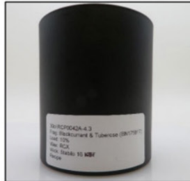
Before Burn Front - Sample 3