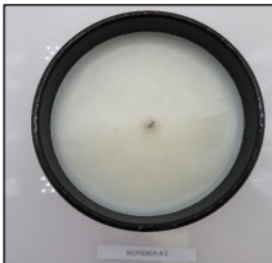
Before Burn Top - Sample 2