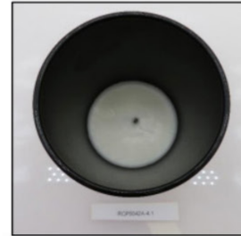
End of Burn Top - Sample 1