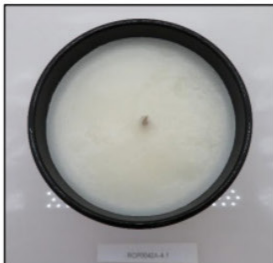
Before Burn Top - Sample 1