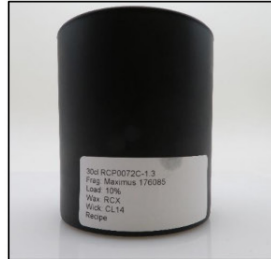
Before Burn Front - Sample 3