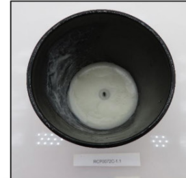
End of Burn Top - Sample 1