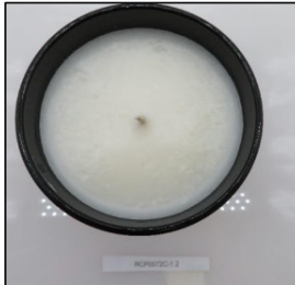
Before Burn Top - Sample 2