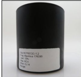
Before Burn Front - Sample 2