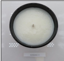
Before Burn Top - Sample 1