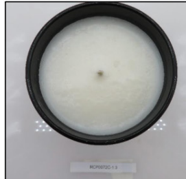
Before Burn Top - Sample 3