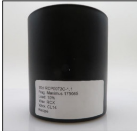
Before Burn Front - Sample 1