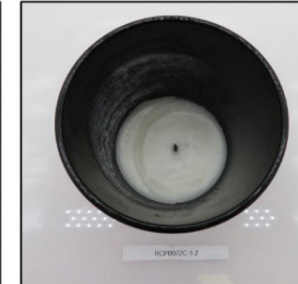
End of Burn Top - Sample 2