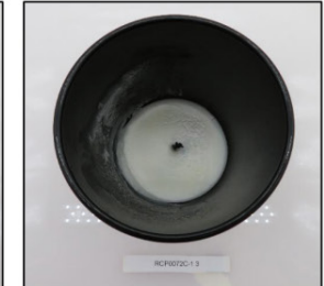
End of Burn Top - Sample 3