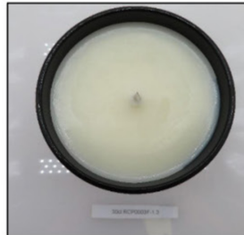
Before Burn Top - Sample 3