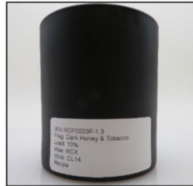
Before Burn Front - Sample 3