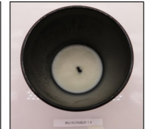
End of Burn Top - Sample 3