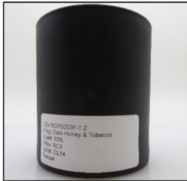
Before Burn Front - Sample 2