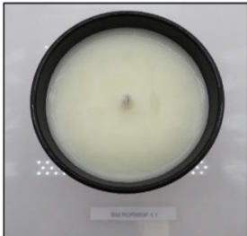
Before Burn Top - Sample 1