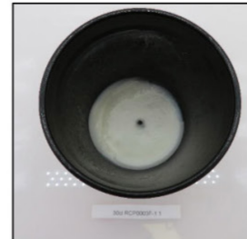
End of Burn Top - Sample 1