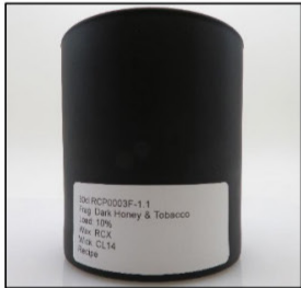
Before Burn Front - Sample 1