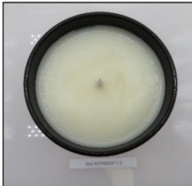
Before Burn Top - Sample 2