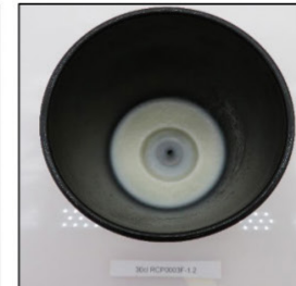
End of Burn Top - Sample 2