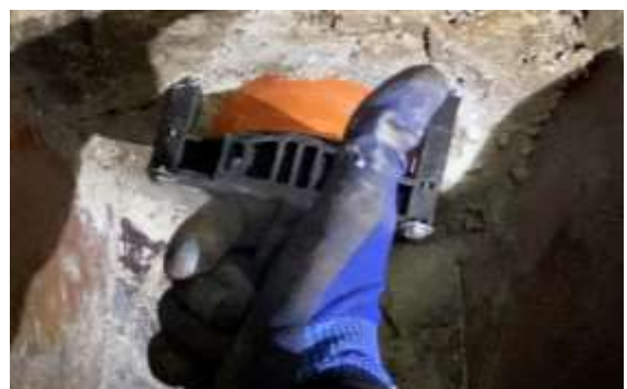
Montagesicherungsband entfernen. FERTIG und funktionsbereit.