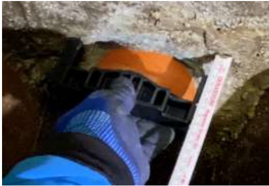
Einpassen des Fixierteils. Bei Bedarf Stege kürzen.