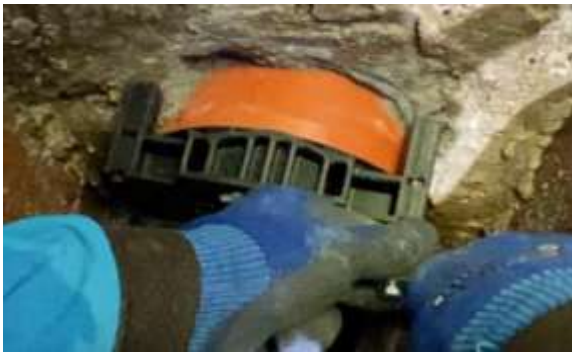
Anzeichnen der Bohrlöcher. ACHTUNG: Schrauben und Dübel sind nicht im Lieferumfang enthalten. Benötigt werden 6mm Schrauben inkl. Beilagscheiben und passende Dübel.