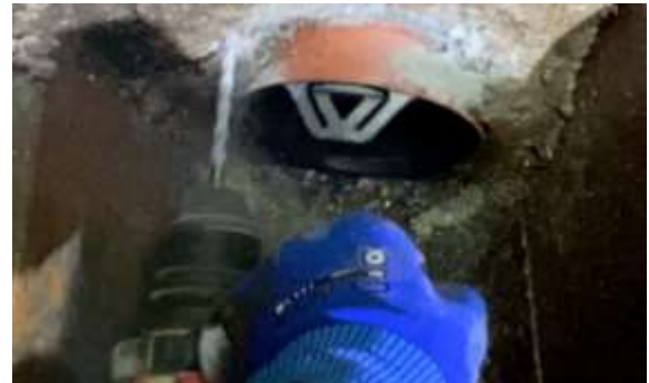
Bohren der Löcher und entfernen des Bohrstaubes.