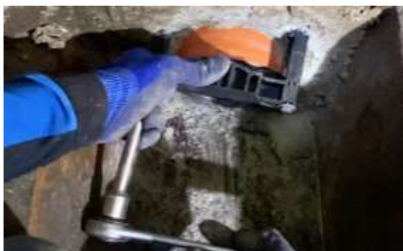
Einschlagen der Dübel und Befestigen der Schrauben.