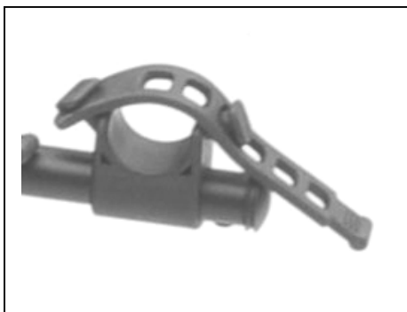
Fig. 3: Bike Cradle