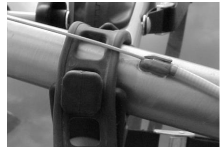
Fig. 4b Recommended

6. Attach the rubber straps to the rubber cradles per Fig. 3. Start with the round (end) hole of the strap stretched over the diamond shaped anchor on the cradle. After the bike is mounted, attach one of the square holes on the strap to the front anchor so that the strap fits snug over the bike frame. Check to make certain that all straps are attached correctly before proceeding. Be sure not to route straps over any cables (see Fig. 4a.), but rather under them (see Fig. 4b). This will protect the bike's finish.