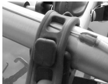
Fig. 4a Not Recommended