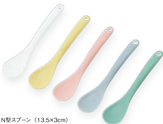
N型spoon 〈13.5×3cm〉 白磁・イエロー・ピンク・グレイ・アクアグリーン 各 ¥990 (取扱価格 ¥900)