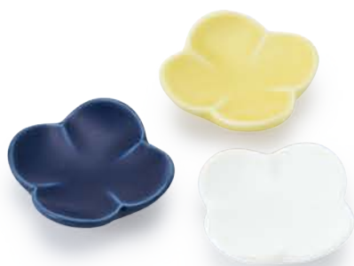
ひらり はしおき 〈4.5×4.5×1.5cm〉 紺マット・黄マット・白磁 各 ¥660 (税抜価格 ¥600)