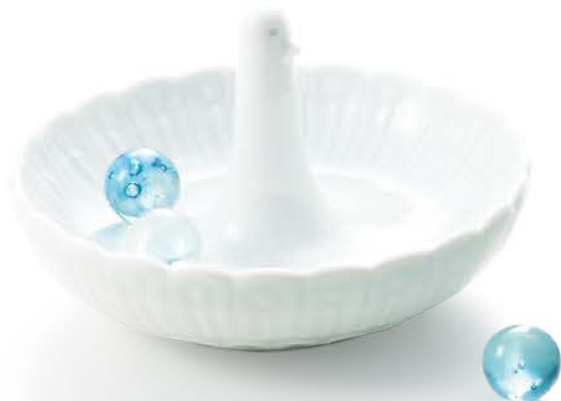
リングトレイ どり 〈φ11.5×7cm〉 ¥3,080 (税抜価格 ¥2,800)

生活の便利さに楽しさを添える名脇役の小物たちも 細部にいたるまで工夫をこらし、丁寧に作り込んでいます。