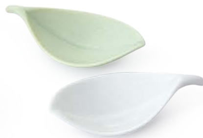
木の葉 はしおき 〈8×4×1.5cm〉 浅緑・白 各 ¥660 (税抜価格 ¥600)