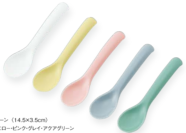
C型spoon 〈14.5×3.5cm〉 白磁・イエロー・ピンク・グレイ・アクアグリーン 各 ¥990 (取扱価格 ¥900)