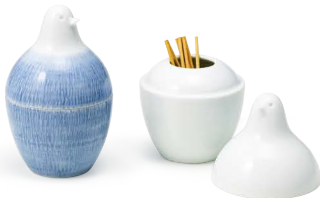
とり型蓋付ようじ立て 〈φ6×9.5cm〉 トピカンナ ¥3,080 (税抜価格 ¥2,800) 白磁 ¥2,420 (税抜価格 ¥2,200)

卵型のシルエットのほのぼのとした表情が、 愛らしいようじ立てです。 綿棒など、生活小物の収納にも適しています。