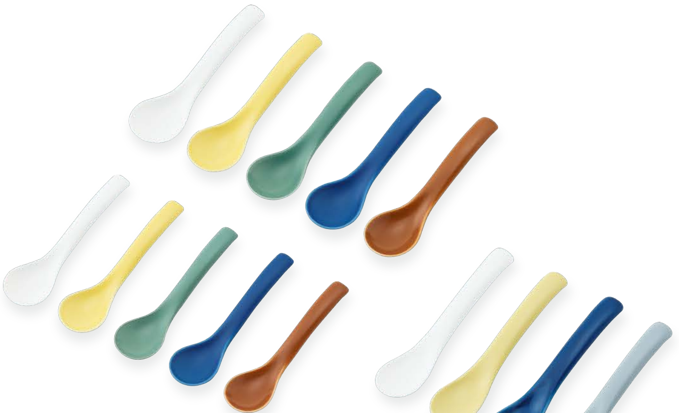
スーpspoon(大) 〈16×4.5cm〉 白マット・黄マット・グリーンマット・ブルーマット・茶マット 各 ¥1,100 (取扱価格 ¥1,000) スーpspoon(小) 〈15.5×4cm〉 白マット・黄マット・グリーンマット・ブルーマット・茶マット 各 ¥990 (取扱価格 ¥900)