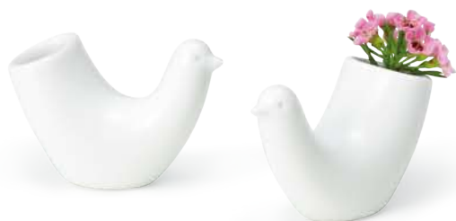
とり型ようじ立て 〈7×3×5cm〉 白マット 1個 ¥1,430 (税抜価格 ¥1,300)