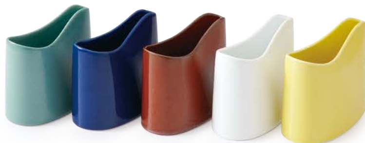
ポケット しゃもじたて 〈12.5×6.5×11.5cm〉 グリーンマット・紺青・鉄赤・ホワイト・黄マット 各 ¥2,420 (税抜価格 ¥2,200)

※一般家庭用の約φ9cmの玉杓子を基準にしています。 大きいもの、偏形型、深型のもの、レードルなどは入らない場合があります。