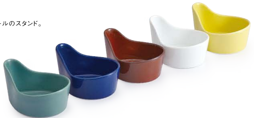
ポケット お玉たて 〈13×10.5×7.5cm〉 グリーンマット・紺青・鉄赤・ホワイト・黄マット 各 ¥2,200 (税抜価格 ¥2,000)

※一般家庭用の約φ9cmの玉杓子を基準にしています。 大きいもの、偏形型、深型のもの、レードルなどは入らない場合があります。