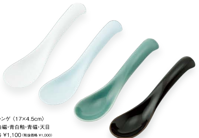
レンゲ 〈17×4.5cm〉 白磁・青白釉・青磁・天目 各 ¥1,100 (取扱価格 ¥1,000)