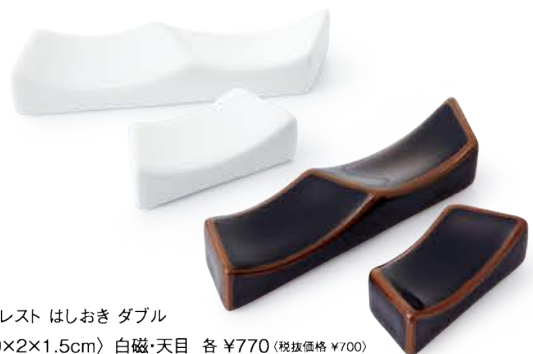
クレスト はしおき ダブル 〈9×2×1.5cm〉 白磁・天目 各 ¥770 (税抜価格 ¥700) クレスト はしおき シングル 〈5×2×1.5cm〉 白磁・天目 各 ¥550 (税抜価格 ¥500)