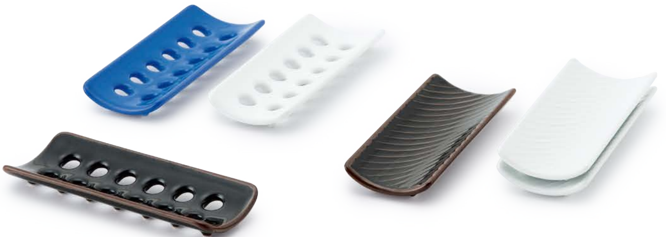
透かしおしぼり 〈15×6cm〉 ルリ・白磁・天目 各 ¥1,320 (税抜価格 ¥1,200)