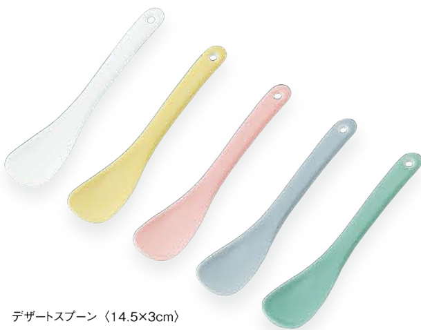
デザートspoon 〈14.5×3cm〉 白磁・イエロー・ピンク・グレイ・アクアグリーン 各 ¥990 (取扱価格 ¥900)