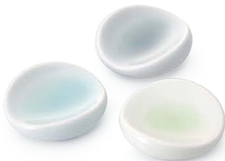
くぼみ はしおき 〈φ5.5×1.5cm〉 ミント・ライム・グレイ 各 ¥880 (税抜価格 ¥800)