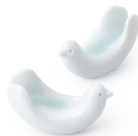
とり型はしおき 〈5.5×2.5×3cm〉 1個 ¥660 (税抜価格 ¥600)