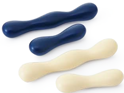
ナッツ はしおき ダブル 〈9×1.5×1.5cm〉 紺マット・ベージュマット 各 ¥770 (税抜価格 ¥700) ナッツ はしおき シングル 〈5.5×1.5×1.5cm〉 紺マット・ベージュマット 各 ¥550 (税抜価格 ¥500)