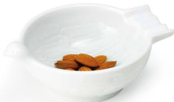
ナッツボール どり 〈14×10.5×5.5cm〉 ¥3,080 (税抜価格 ¥2,800)