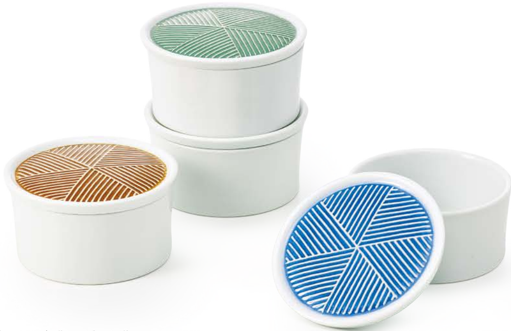
反りふたもの(M) 〈φ11×6cm〉 黄・ルリ・グリーン・茶 各 ¥2,750 (税抜価格 ¥2,500)

重なりにすぐれ、収納に便利な蓋付きの容器です。 蓋のさわやかな色あいと白磁の対比が美しく、レリーフのラインが際立ちます。