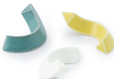
ワインド はしおき 〈5.5×3×2cm〉 グリーンマット・白マット・黄マット 各 ¥660 (税抜価格 ¥600)