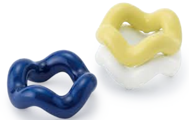
チューブ はしおき 〈φ5×2cm〉 ブルー・イエロー・ホワイト 各 ¥880 (税抜価格 ¥800)