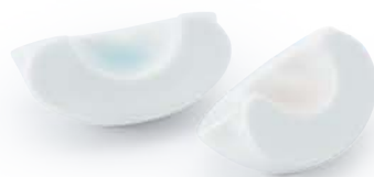
プラム はしおき 〈4.5×3×2cm〉 ブルー・ピンク 各 ¥660 (税抜価格 ¥600)