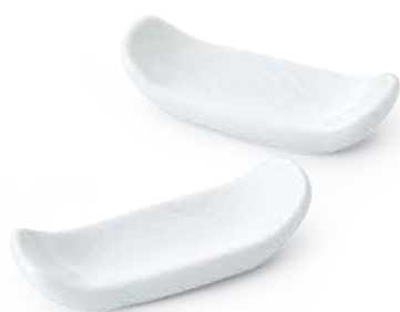
さざなみ はしおき 〈7×2.5×2cm〉 白磁 1個 ¥660 (税抜価格 ¥600)