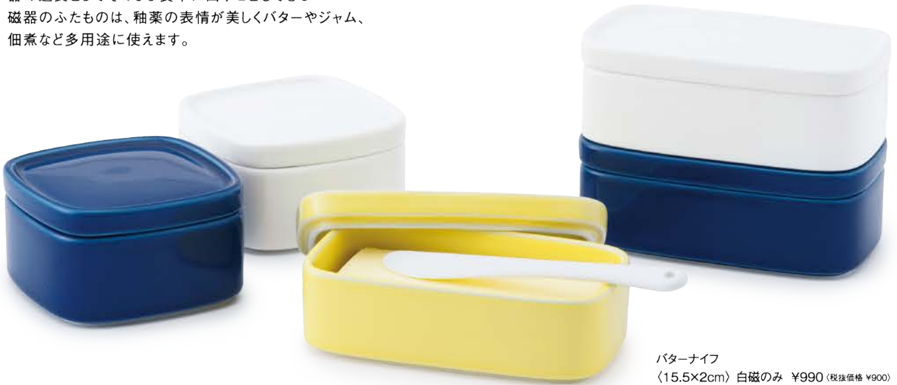
バターナイフ 〈15.5×2cm〉 白磁のみ ¥990 (税抜価格 ¥900)

器の延長としてそのまま食卓に出すこともできる 磁器のふたものは、釉薬の表情が美しくバターやジャム、 佃煮など多用途に使えます。