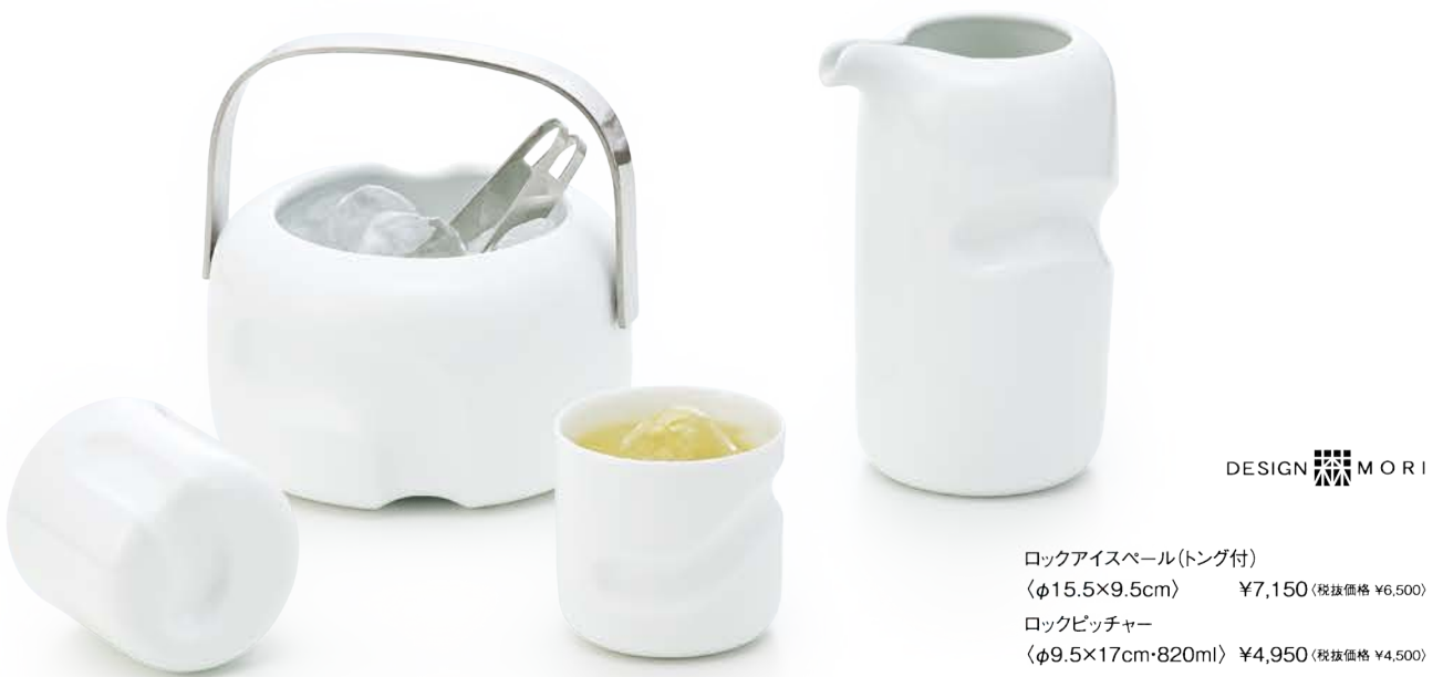
ロックアイスボール(トング付) 〈φ15.5×9.5cm〉 ¥7,150 (税抜価格 ¥6,500) ロックピッチャー 〈φ9.5×17cm・820ml〉 ¥4,950 (税抜価格 ¥4,500)

レリーフのくぼみに指がフィットするユニークな造形。 磁器のカップに響く氷の音がウイスキーの味わいを引き立てます。