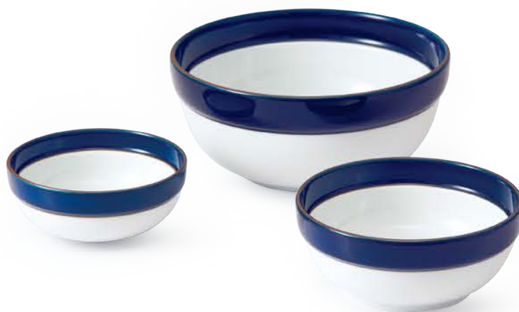
7号ボール 〈φ20.5×9cm〉 ¥7,150 (税抜価格 ¥6,500)