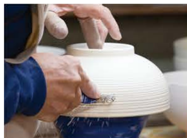
千段彫は一つひとつ手作業によるもの。

1960年代からつくり続けている定番シリーズです。 幾重にも施された千段彫が深みのある白磁の表情を引き出し、 縁錆が器全体を引きしめています。 豊富なラインアップから用途に応じてお選びください。