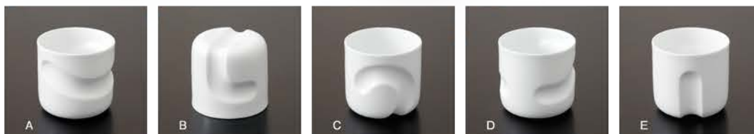
ロックカップ 〈φ8×7.5cm〉 A~E 各 ¥2,200 (税抜価格 ¥2,000)