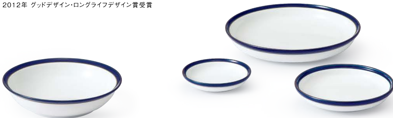
スープ皿 〈φ18×4.5cm〉 ¥2,970 (税抜価格 ¥2,700)