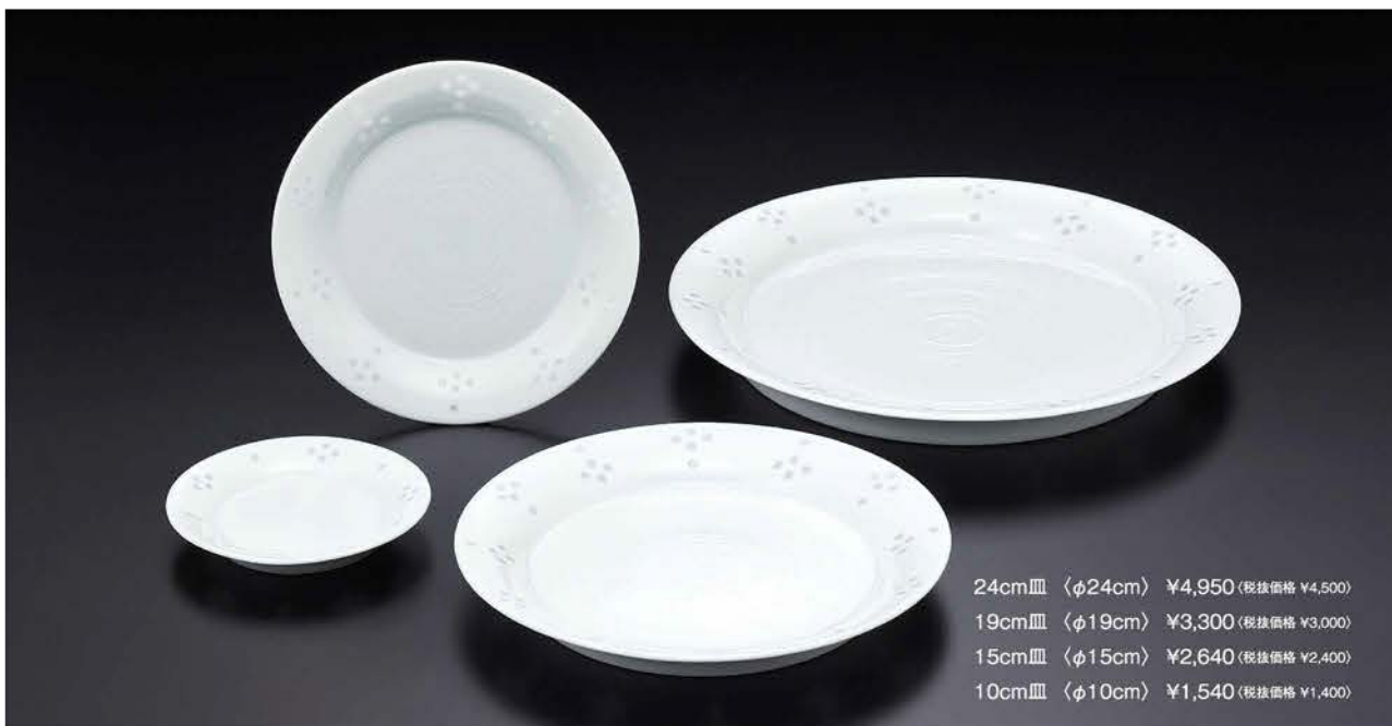
24cm皿 〈φ24cm〉 ¥4,950 (税抜価格 ¥4,500) 19cm皿 〈φ19cm〉 ¥3,300 (税抜価格 ¥3,000) 15cm皿 〈φ15cm〉 ¥2,640 (税抜価格 ¥2,400) 10cm皿 〈φ10cm〉 ¥1,540 (税抜価格 ¥1,400)