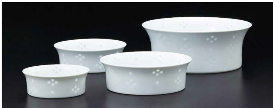
12cmボール 〈φ12×4cm〉 ¥2,640 (税抜価格 ¥2,400) 10cmボール 〈φ10×3.5cm〉 ¥1,980 (税抜価格 ¥1,800)