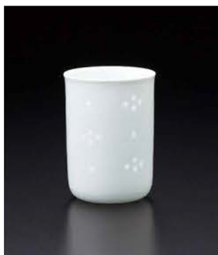
Q型コップ 〈φ6×8cm・160ml〉 ¥2,640 (税抜価格 ¥2,400)