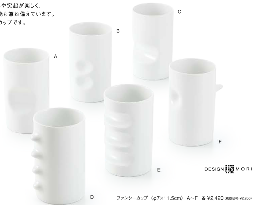
ファンシーカップ 〈φ7×11.5cm〉 A~F 各 ¥2,420 (税抜価格 ¥2,200)