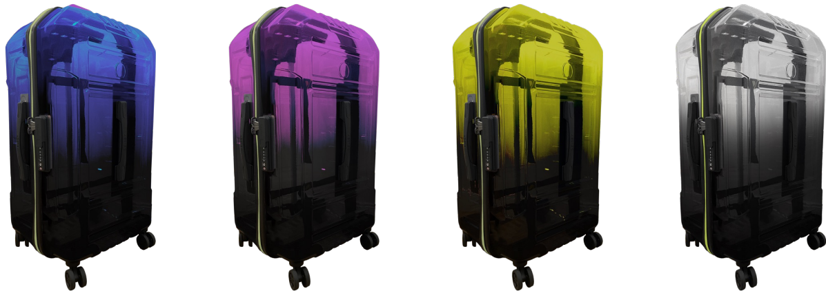
【新作】ランパート 55cm ¥52,580

デルセーラボリニューアルに際して、「ネオ・トーキョー」のテーマに合わせたラインを発売いたします。デルセーラボの人気コレクション「ランパート」より、ボディが半透明で、ジッパーが蛍光色の近未来デザインのスーツケースが登場。ランパートコレクションは、アウトドアの雰囲気とスタッキングできる設計、ボディとジッパーの色の組み合わせが特徴的で、発売と同時に世界中で人気となったコレクション。ツヤのある明るいカラーと屈強な見た目に、ジップセキュリテックファスナー(*)が荷物の安全を守ってくれる、信頼できる旅のパートナーです。