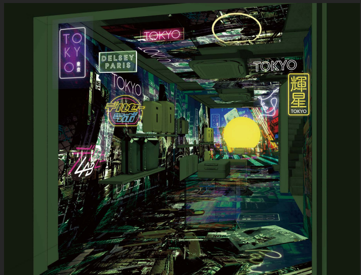
1階・インスタレーション(夜)