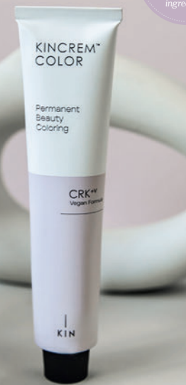
Tubo XL / XL Tube 100 ml

70% ingredientes de origen natural natural origin ingredients