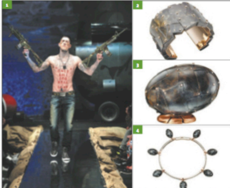
1. Дизайнеры призывают не забывать о том, что оружие опасно. 2-3. Браслет и кольцо из оружейного металла. 4. Ожерелье из пуль