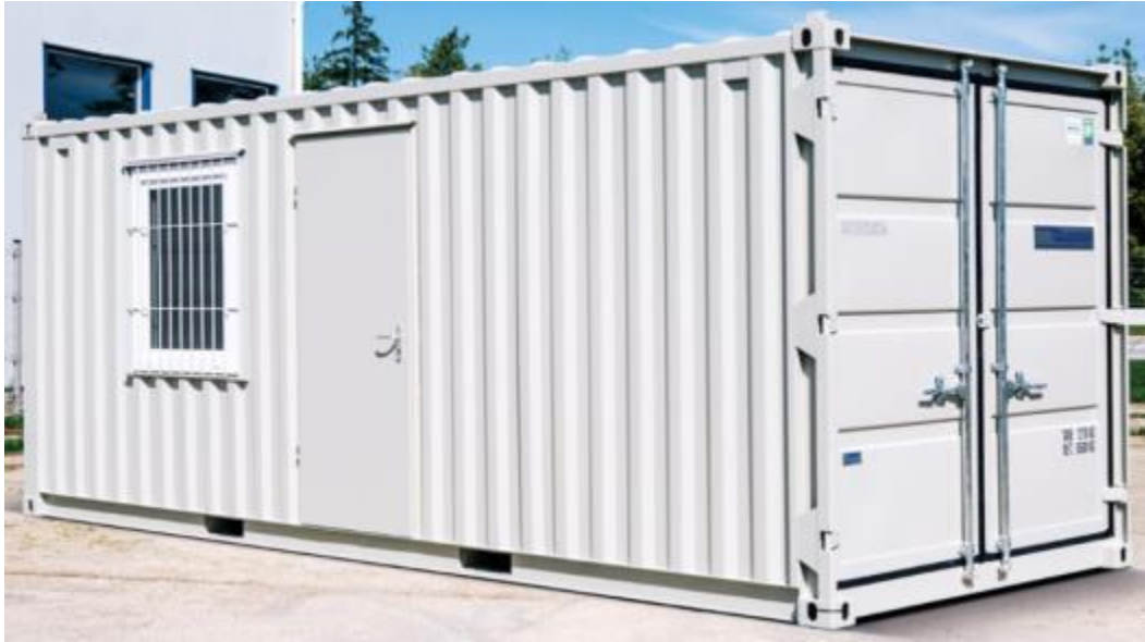
Tür/Fenster inkl. Gitter