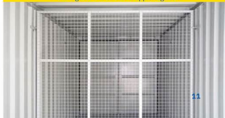
Trenngitter mit zweiter Doppelflügeltür