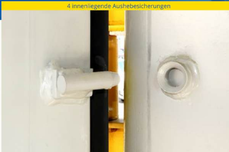
4 innenliegende Aushebesicherungen