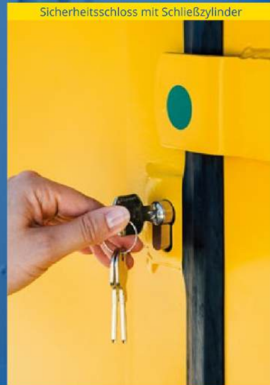
Sicherheitsschloss mit Schließzylinder