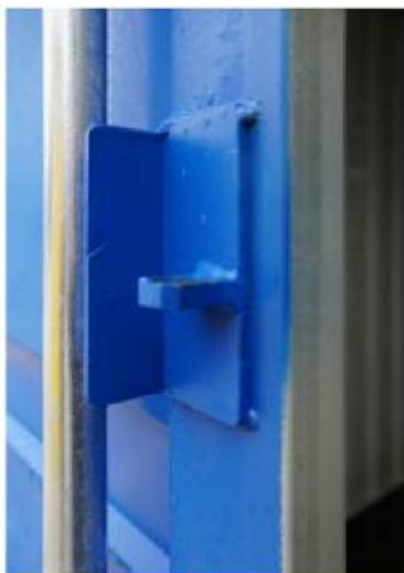
Halterung für Vorhangschloss