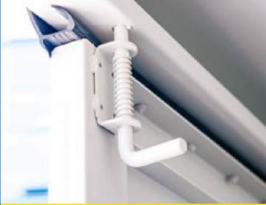
2 innenliegende Verriegelungen