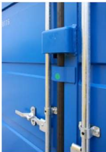
Das Schloss ist geschützt