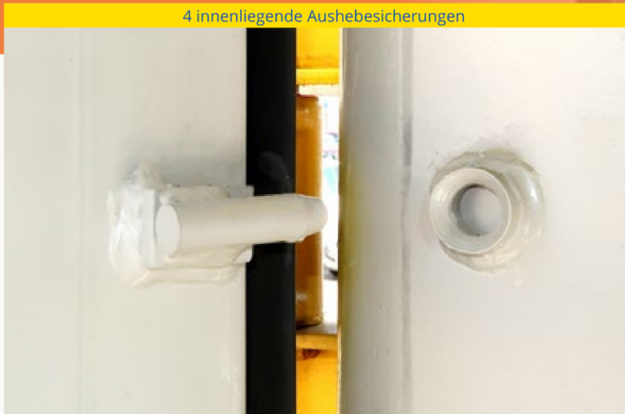
4 innenliegende Aushebesicherungen