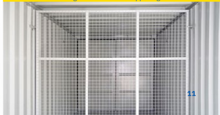
Trenngitter mit zweiter Doppelflügeltür