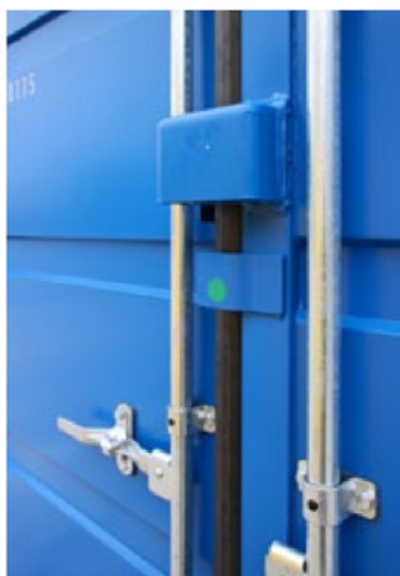
Das Schloss ist geschützt