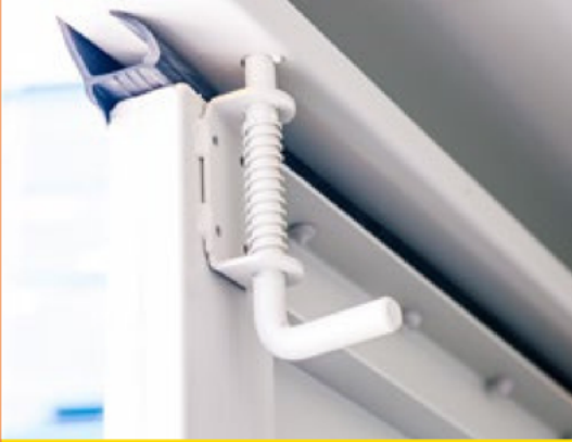
2 innenliegende Verriegelungen