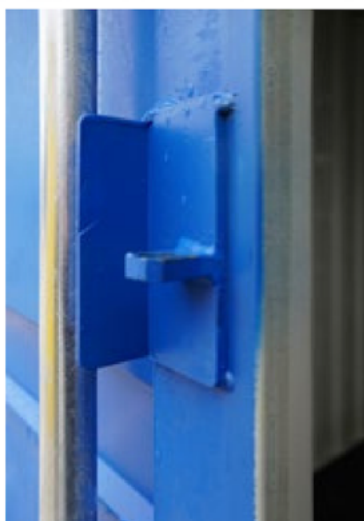
Halterung für Vorhangschloss