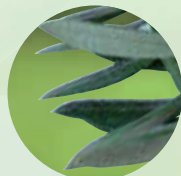
オリーブ リーフエキス