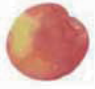
* ウメ果実エキス。 和歌山産