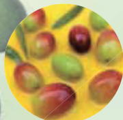
オリーブ バージンオイル