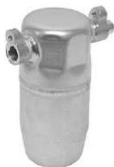
ACUMULADORES HD PARA GAS/ACEITE REFRIGERANTE DEF-0244-13