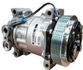
COMPRESORES DENSO HDR DE ALTA CAPACIDAD CO-2679-14