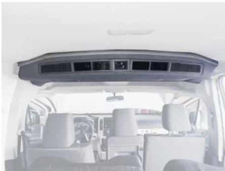
UNIDAD EVAPORADORA TIPO ORIGINAL 48,000 BTU'S PTE-7563-421

Los equipos cuentan con componentes de importación garantizados en su desempeño y durabilidad; contamos con una amplia existencia de refacciones y componentes para el mantenimiento óptimo de su unidad.