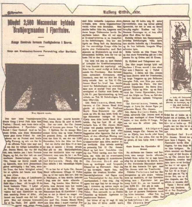
Bratbjergmanden var en folkehelt, der blev lavet film om. Her Aalborg Stiftstidendes omtale fra 1928, da han havde afsonet en dom for brud på loven om kvaksalveri.